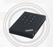
ThinkPad USB 3.0 Sicherheitsfestplattenlaufwerk