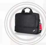
ThinkPad Essential Topload Tasche