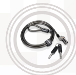
Microsaver DS Kabelverriegelung