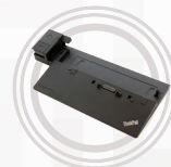
ThinkPad Ultra Dock